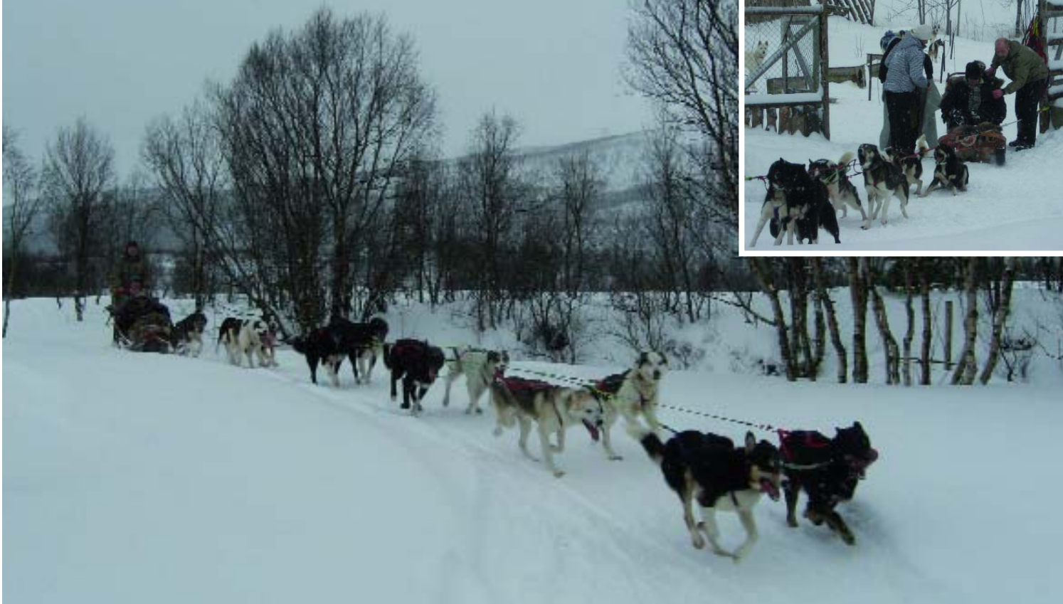
Unsere Hundeschlittenfahrt. Bild rechts oben: Kurz vor dem Start des Hundeschlittens.

Reisegäste laufen können. Man arbeite im Camp zusammen mit integrativen Kindergärten und Schulklassen. Es sei wichtig, dass man diese Erfahrung allen Menschen zugänglich macht. Wir überlegten nicht lange und verabredeten uns für den kommenden Tag.