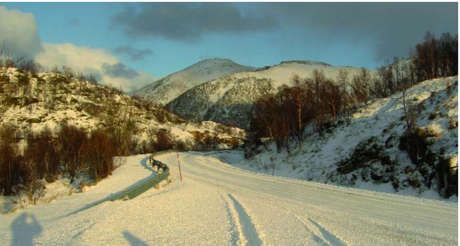
Ausflugsfahrt durch die winterliche Landschaft der Lofoten / Vesterålen.

Einen außergewöhnlichen Urlaub hatten wir uns gewünscht und hier fanden wir unsere Erwartungen erfüllt. Tagsüber treiben immer wieder starke Winde den fallenden Schnee nahezu waagrecht vor sich her. Elche nähern sich den Siedlungen auf der Suche nach Futter, und des Nachts faszinieren die Polarlichter über dem Wasser des "Buksnesfjord". Am Tage ist es wesentlich heller und mit Temperaturen um -5°C