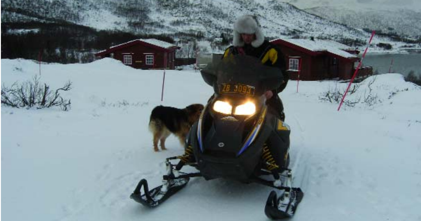
Ein Same auf dem Weg zu seinen Rentieren.

wesentlich milder, als wir erwartet hatten. Wir dachten an lange Polarnächte, wenig Sonne und das Empfinden von unendlicher Einsamkeit im Dämmerlicht des Tages. Stattdessen zerreißt der Wind immer wieder die Wolkendecke, erstrahlt die Sonne vom klaren Himmel und lässt die verschneiten Weiten in einem kristallklaren