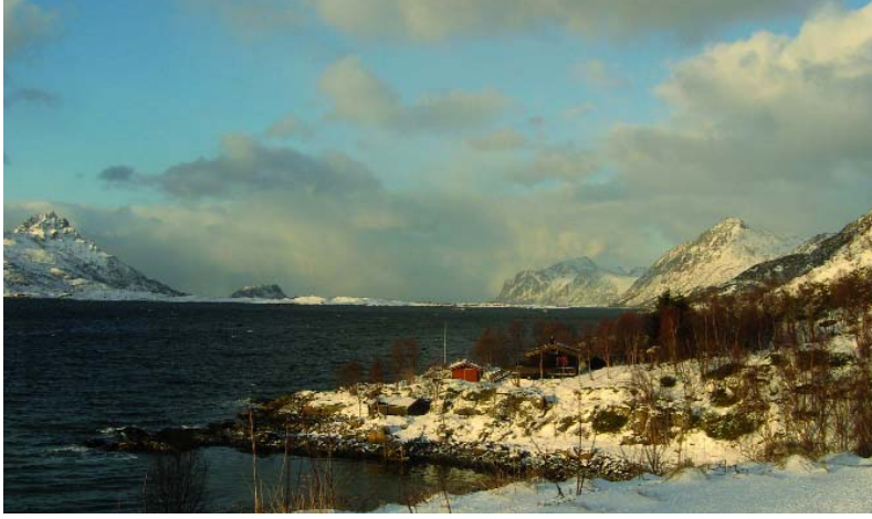
Blick aus unserer Hütte auf den verschneiten Buksnesfjord.

fahrens und das gutmütige Wesen der Tiere könnte man als Anfänger diesen Moment kurz vor dem Losfahren sicher nicht genießen. Die Paarungen, die nebeneinander laufen, werden sorgfältig ausgesucht. Immer wieder bewegte sich der Schlitten ruckartig im Takt der wild ziehenden Hunde. Ein unbeschreibliches Erlebnis! Als der letzte Hund eingespannt war, erreichte die freudige Ungeduld der Tiere einen lautstarken und absolut energiegeladenen Höhepunkt.