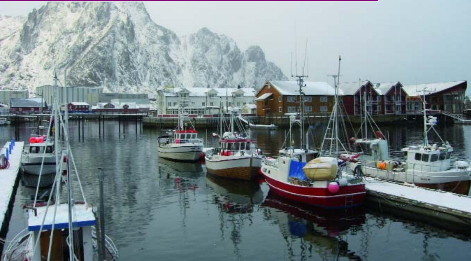
Foto oben: Der Hafen von Svoldvaer vor der Felskulisse der Lofoten. Foto unten: Die Vorbereitungen zu unserer Hundeschlittenfahrt.