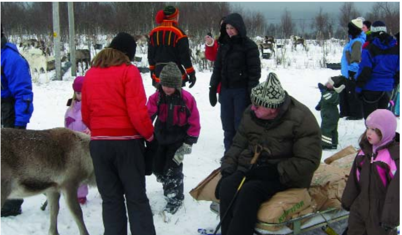
Zu Besuch in einem Samen-Camp. Ein Erlebnis für die ganze Familie.

Ein Schlitten war bereits mit Fellen belegt und stand für uns bereit. Wir bestiegen den Schlitten jeweils mit einem Assistenten von "Weitsprung-Reisen" und nach und nach wurden 12 Hunde eingespannt. Die Hunde wurden immer aufgeregter und das heisere Gebell überschlug sich regelrecht. Jedes Tier wollte Teil der Gruppe sein, die den Schlitten ziehen darf. Ohne die gründliche Einführung in die Philosophie des Hundeschlitten-