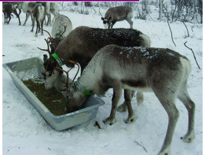
Zu Besuch in einem Samen-Camp - die Fütterung der Rentiere.

kämpfen teil. Aus dem einstigen Hobby wurde für sie eine Leidenschaft. Sie teilen ihr Leben mit den Huskies und führten uns in die Philosophie des Hundeschlittens ein. Sie beschrieben mit leuchtenden Augen das friedvolle Gemüt der Schlittenhunde und die Faszination von Langstreckenrennen, welche etwas weiter nördlich in der Finnmark stattfinden.