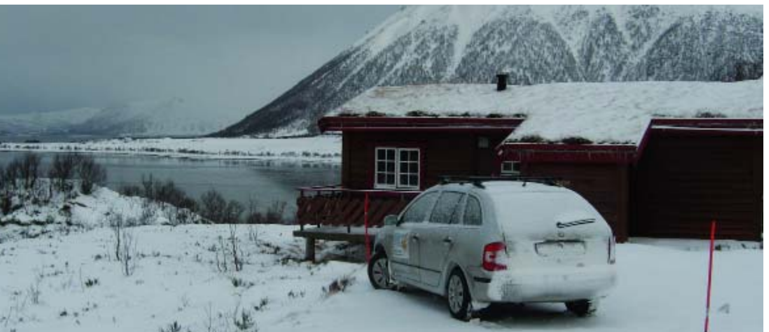
Gemütliche rollstuhlgeeignete Hütten am Fjord.