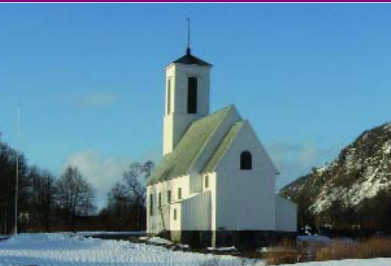
Die Kirche von Melbu.