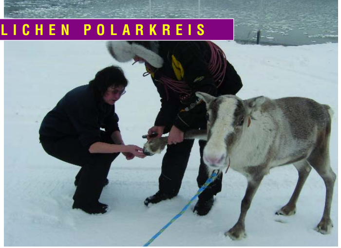
Eine Pferdekennnerin betrachtet sich die Hufe eines Rentiers.

Reisebegleiter bei Weitsprung-Reisen, gibt in seinem Bericht auszugsweise seine Eindrücke und die der kleinen Reisegruppe wieder, die Norwegen vom 09. bis 23. Februar 2008 bereiste.