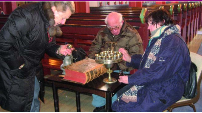
Wir betrachten in der Kirche von Sortland eine Bibel aus dem 18. Jahrhundert.